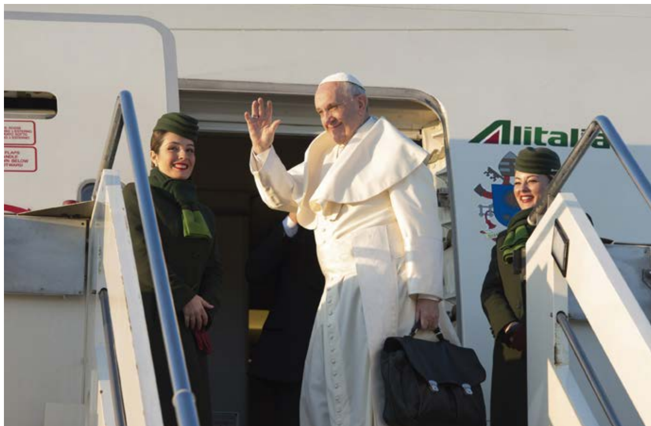
Es posible que esta imagen no se vea en el año 2020.

Como regla general, cada visita del Papa reúne a cientos de miles e incluso millones de participantes, y durante varios días ocupa el lugar central en los medios de comunicación. Como invitado del Estado, también puede dirigir sus discursos en lugares donde la voz de la Iglesia católica no es aceptada fácilmente. Las celebraciones litúrgicas presididas por el Papa también sirven