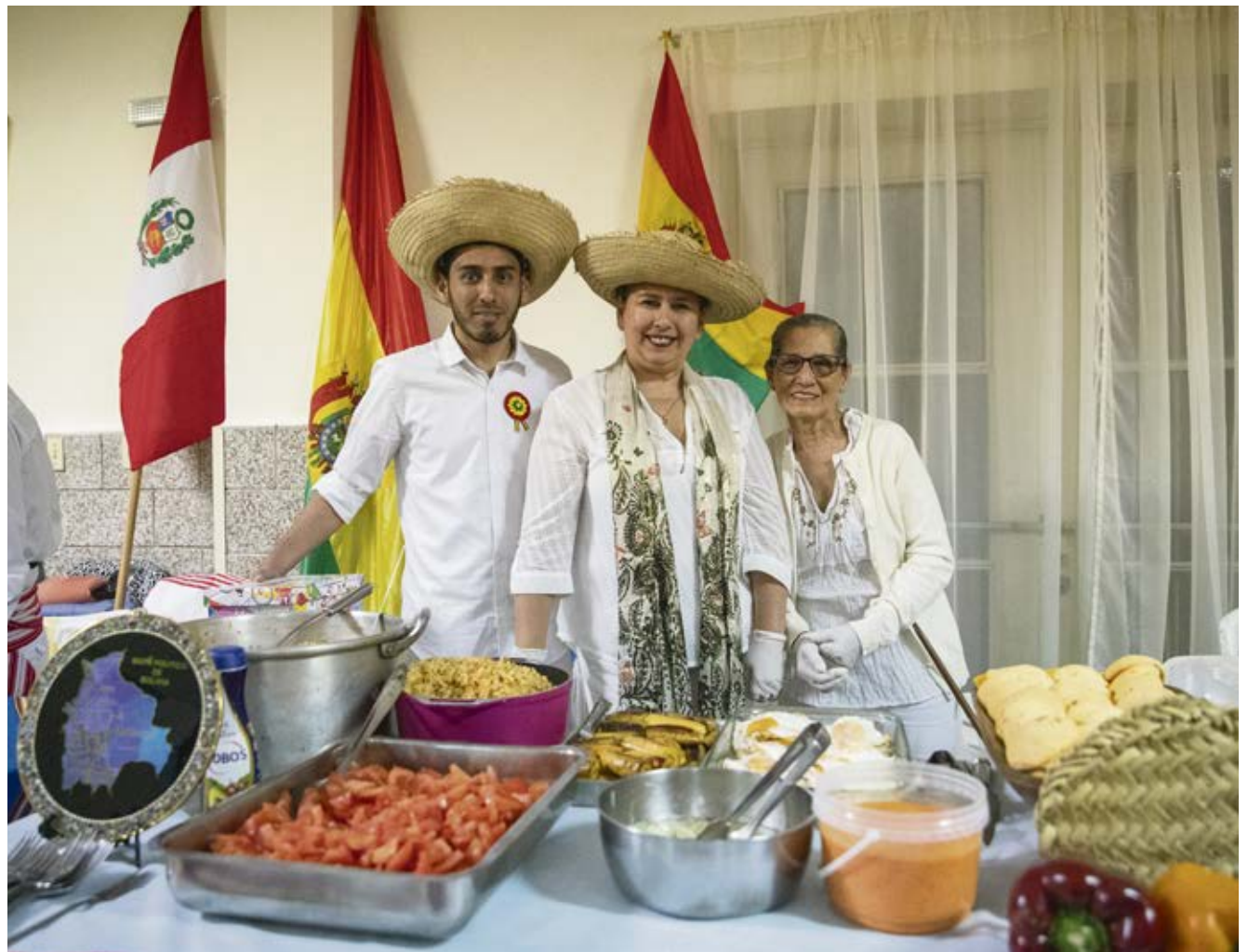
Puentes de Solidaridad busca que cada uno mantenga su cultura de origen.

Sin dudas, otro paso significativo para Puentes de Solidaridad en este año fue la apertura de la casa del migrante "Paz y bien" en la localidad del Fortín de Santa Rosa, a 40 Km de la capital. El proyecto