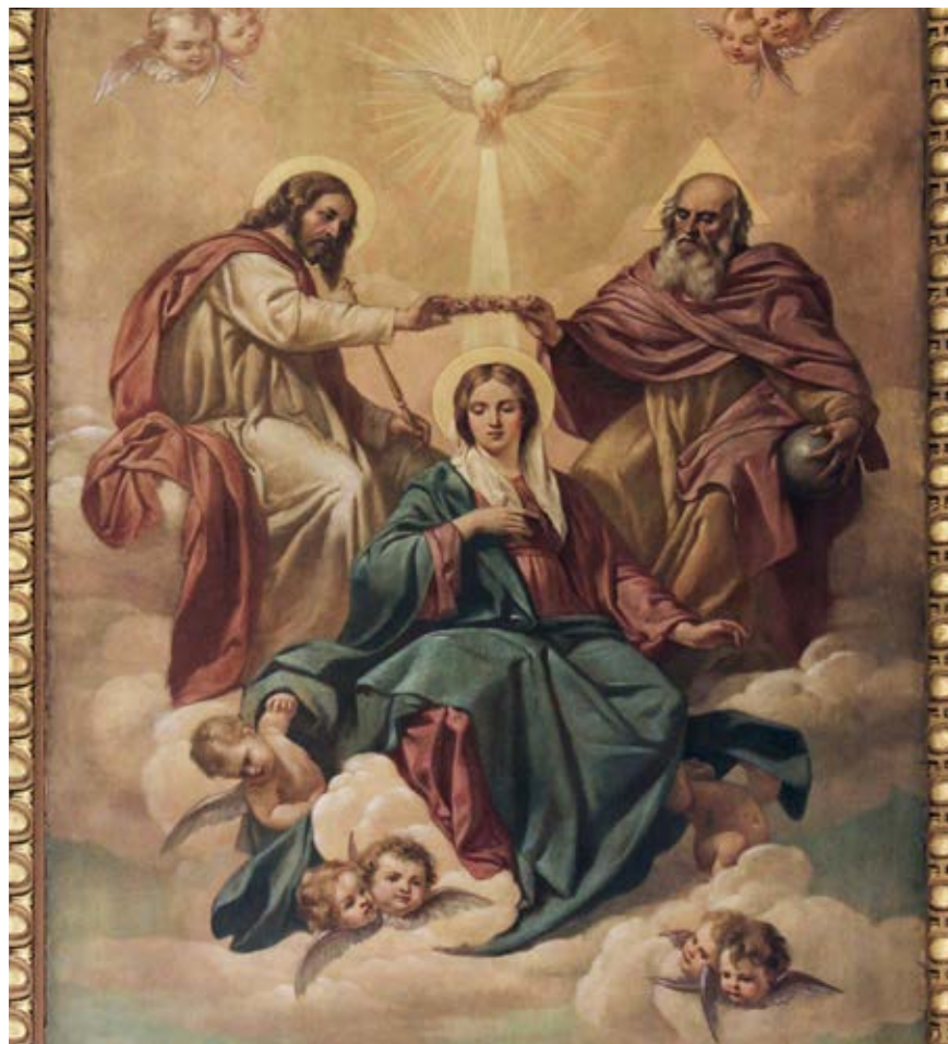
Coronación de la Virgen, cuadro en un templo en Baltimore.

En la colección de hagiografías The Golden Legend sobre el Papa