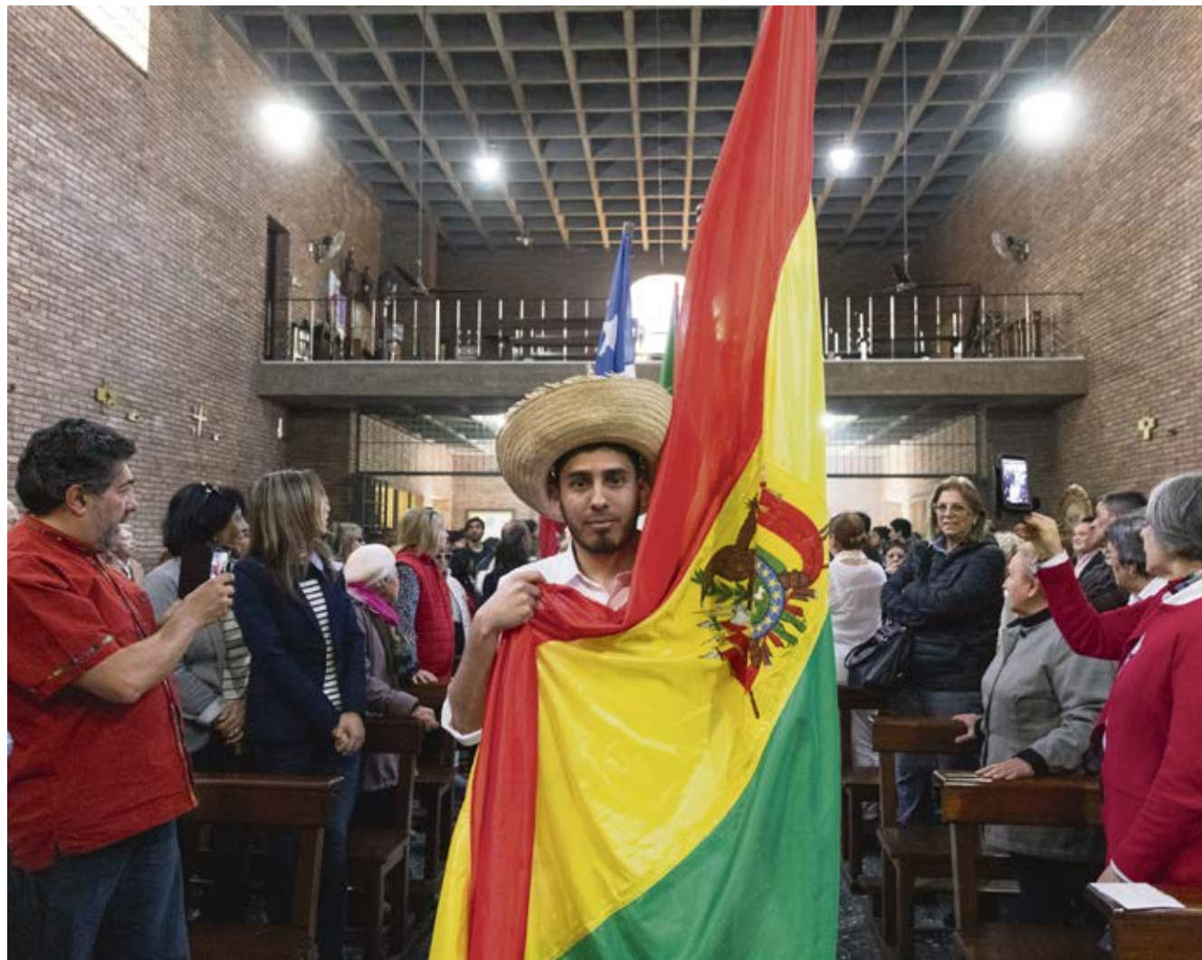
En la 105ª Jornada Mundial del Migrante celebraron con una Misa.

Para realizar este trabajo, Puentes de Solidaridad cuenta actualmente con tres centros de atención: uno en Montevideo, en la Parroquia de la Aguada; otro en Rivera, en la