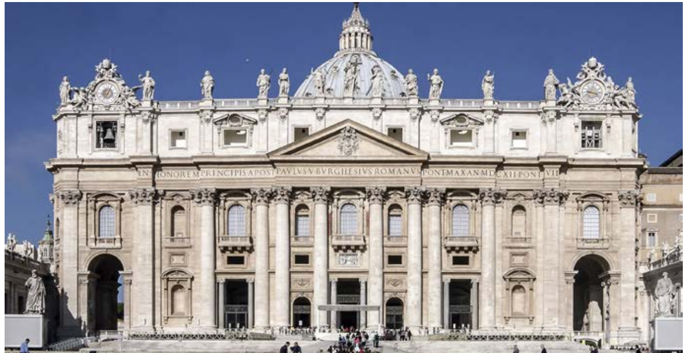
En mayo el Vaticano comenzará la gradual reactivación de sus servicios.