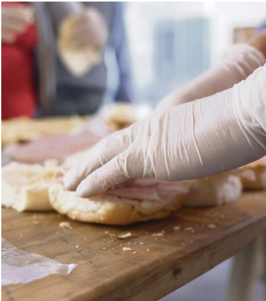
En algunas parroquias preparan refuerzos para complementar. F. GUTIÉRREZ