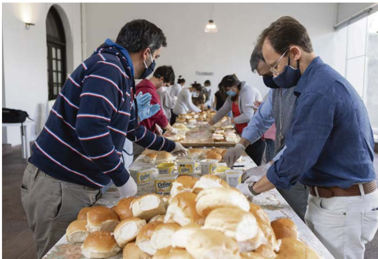
Jóvenes y adultos coinciden en el trabajo y oración en favor de los más necesitados. F. GUTIÉRREZ