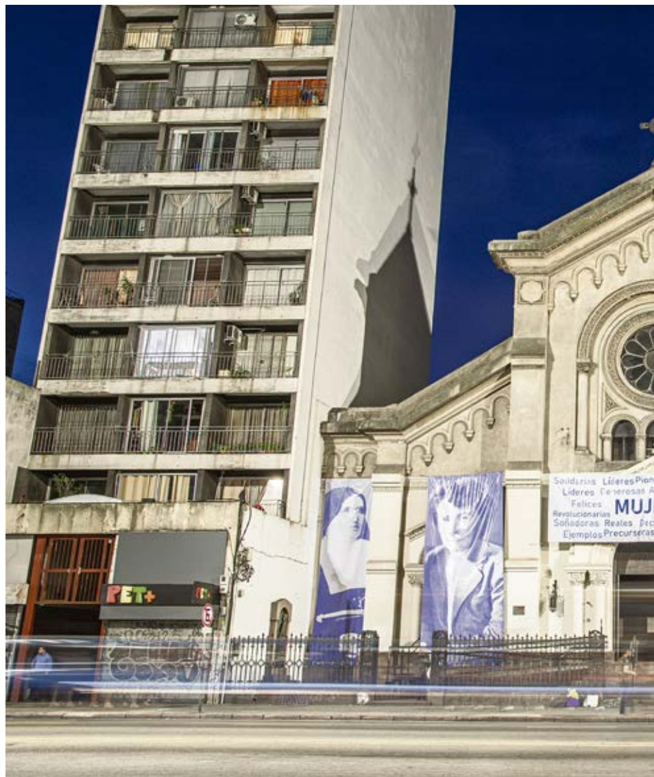
La legislación contempla el derecho a la libertad religiosa.

En el cumplimiento de esta misión, siempre tendremos como referencia fundamental el Art. 18 de la Declaración Universal de los Derechos Humanos: