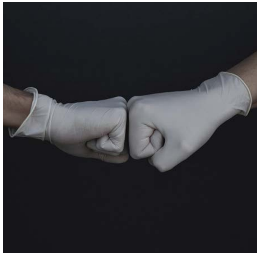
La pandemia deja en evidencia la interdependencia.

En definitiva, la situación que estamos atravesando nos ofrece, a todos, la invalorable oportunidad de honrar nuestra condición humana, prodigando cuidados a quien lo necesite. •