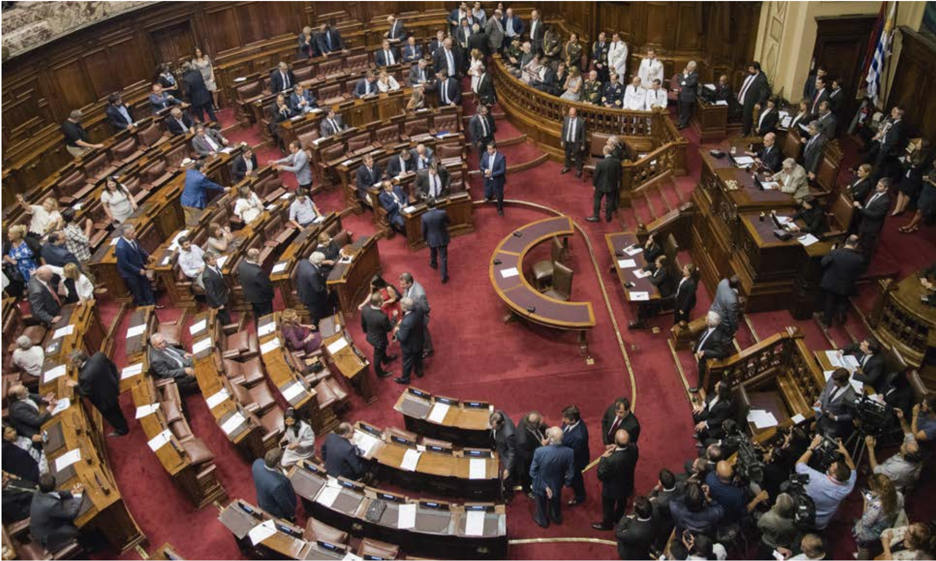
La verdadera política presupone necesariamente la ética. PARLAMENTO DE URUGUAY