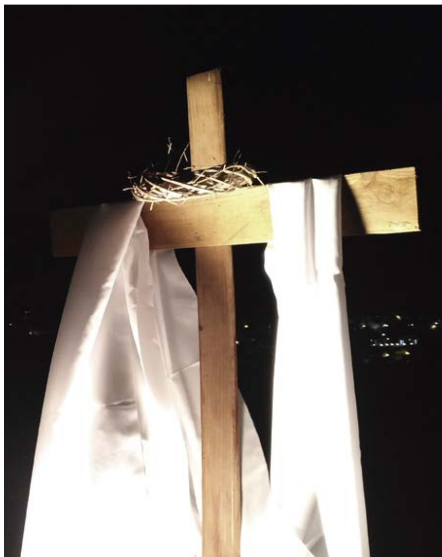
Al principio los discípulos no asumieron la resurrección.

Ciertamente, tenemos que pensar que los días que siguieron a la muerte de Jesús debieron ser agobiantes para todos. ¿Quién mantenía la esperanza en la resurrección prometida? Ni siquiera la palabra que las mujeres trajeron de parte de los ángeles presentes en el sepulcro les hizo creer: “No está aquí. Ha resucitado”. Y los ángeles les recordaron el anuncio de la muerte y la resurrección. Recién entonces, “las mujeres recordaron sus palabras”.