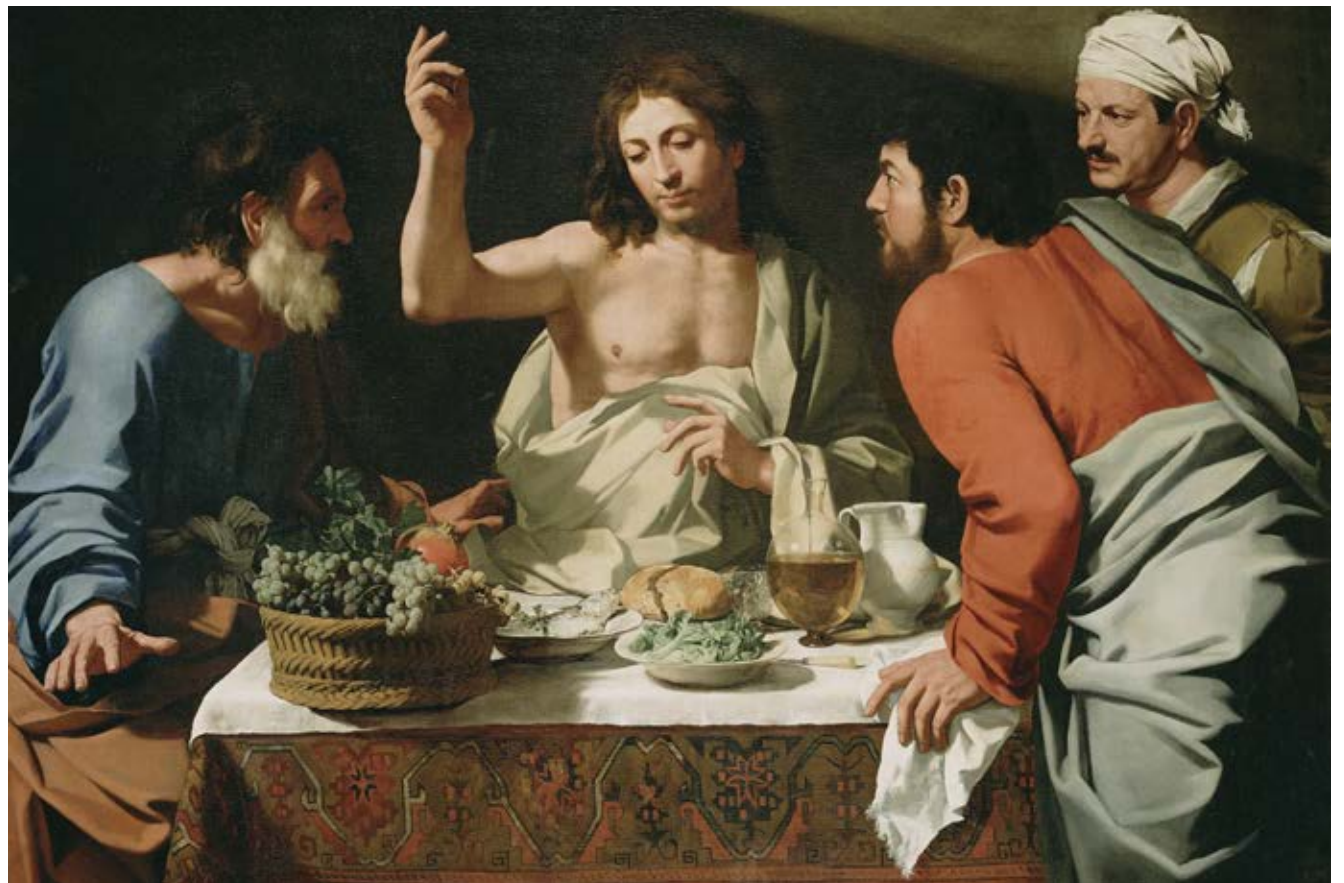
Las dudas de Tomás dejaron una enseñanza para todos.

Los encuentros con Cristo resucitado estaban fuera del catálogo de experiencias humanas. La plenitud de vida que se manifiesta en Jesús, “aunque velada bajo los rasgos de una humanidad ordinaria” (Catecismo n. 659), común, aunque velada bajo una gloria escondida, disimulada, contenida, se manifiesta igualmente en las particularidades extraordinarias que trasuntan los relatos y las reacciones de desconcierto de los discípulos. No se trata de un fantasma, de un espíritu venido de entre los muertos, ni de una ilusión óptica, ni de una proyección interior o una ensoñación, ni siquiera tampoco de una visión mística como encontramos en numerosos santos. No. Ese que está ahí sucede objetivamente, acontece desde fuera. Jesús mismo insiste en ello, insiste en su presencia corporal: