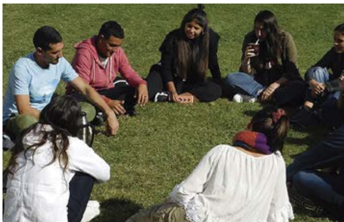
Uno de sus pilares es la búsqueda de la unidad. MOV. FOCOLAR

por la oración de Jesús al Padre “para que todos sean uno” (Jn 17,21). Para alcanzar esa meta se pone como prioridad el diálogo, el compromiso constante de construir puentes y relaciones de fraternidad entre las personas, los pueblos y los ámbitos culturales.